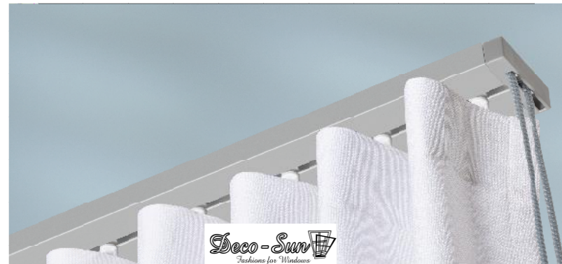
Photo mit Schiene Moderno